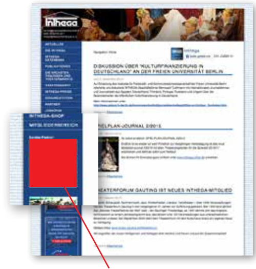
Service-Partner auf der INTHEGA-Website (Startseite)

Potentielle Kunden: Die Mitglieder in der INTHEGA-Datenbank